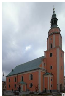
Kościół św. Michała Archanioła

Jedną z najwyższych prudnickich wież posiada kościół pw. św. Michała Archanioła. Za powstanie pierwszego kościoła przyjmuje się rok 1279, a obecna budowla pochodzi z XVIII wieku i reprezentuje styl późnobarokowy. Kościół jest murowany, trójnawowy z jasnym wnętrzem i bogatym wystrojem.