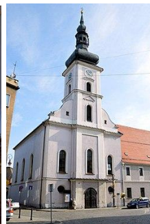
Kościół św. Piotra i Pawła