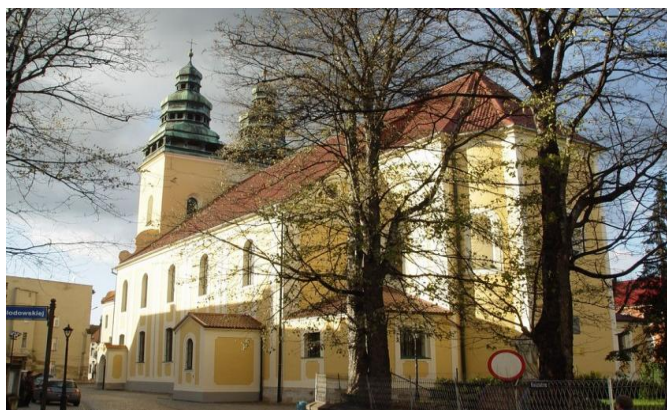
Kościół pw. św Wawrzyńca