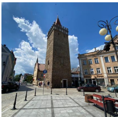
Wieża Bramy Górnej