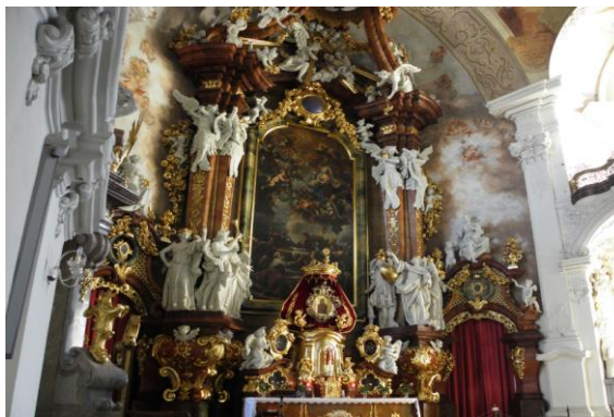
Ołtarz główny w bazylice

W okresie 1919-1946 klasztor zamieszkiwali benedyktyni przesiedleni tutaj z Pragi. W dniu 3 września 1940 przejęły go władze III Rzeszy i umieściły w nim najpierw Niemców karpaccich, a od 1941 Żydów śląskich przed ich wywiezieniem do obozu Theresienstadt. Zimą 1944/1945 klasztor był także schronieniem dla niemieckich przesiedleńców z Węgier i to w nim pod koniec wojny zdeponowano część zbiorów Biblioteki Pruskiej z Berlina. W 1946 roku klasztor objęły ss. benedyktynki ze Lwowa. W latach 1970-2006 pracę duszpasterską ponownie sprawowali cystersi, a od 1992 roku Krzeszów jest częścią Diecezji Legnickiej. W skład opactwa wchodzi Bazylika Wniebowzięcia NMP, kościół pomocniczy św.