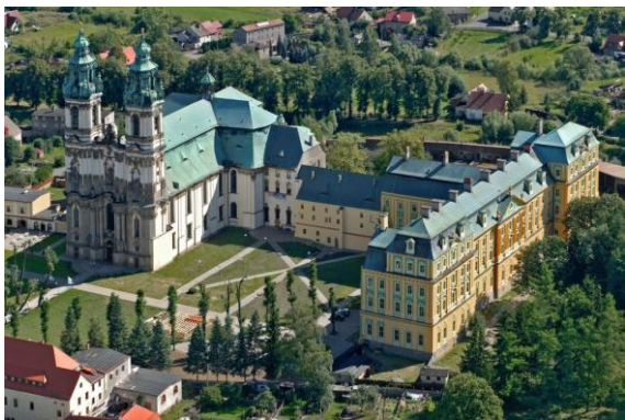
Bazylika i klasztor

Historia opactwa sięga roku 1242, kiedy to czeska księżniczka Anna z Przemyślidów, wdowa po Henryku II Pobożnym, sprowadziła z czeskich Opatowic benedyktynów. Ponad pięćdziesiąt lat później ich miejsce zajęli cystersi sprowadzeni przez księcia świdnicko-jaworskiego z Henrykowa. Opactwa niestety nie ominęły wojny i najazdy. W XVIII wieku tereny te znalazły się pod panowaniem pruskim. W roku 1810 nastąpiła kasata klasztoru i przejęcie jego dóbr przez państwo pruskie.