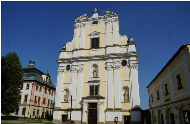
Kościół pw św. Józefa

Józefa, Mauzoleum Piastów Śląskich, kaplica loretańska. Wnętrza zachwycają bogatym wystrojem, wspaniałymi polichromiami, rzeźbami wykonanymi przez mistrzów baroku.