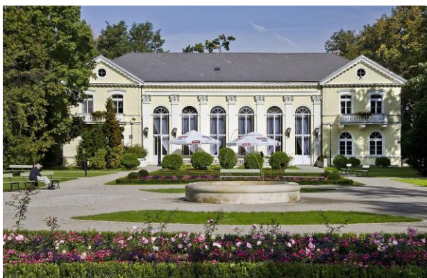
Pawilon Edward w Parku Zdrojowym

Plac Piastowski to centrum cieplickiej starówki i główny deptak . Oprócz pałacu Schaffgotschów znajdują się przy nim budynki uzdrowiskowe, dawne hotele i pensjonaty.