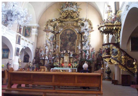
Rzymsko-katolicki św. Jana Chrzciciela

Odwiedzimy także Muzeum Przyrodnicze Podwaliną tej instytucji były pozostałości ogromnej kolekcji rodziny Schaffgotschów (gromadzone od XVI w.), które przechowywane były do 1945 roku w klasztorze pocysterskim, "Długim Domu" oraz pałacach Schaffgotschów w Cieplicach i Sobieszowie. Muzeum utworzono w 1954 roku i początkowo mieściło się w "Długim Domu" (część dawnego klasztoru cysterskiego) a w latach 60-tych zostało przeniesione do Pawilonu Norweskiego w Parku Norweskim w Cieplicach. W 2009 roku Miasto Jelenia Góra przejęło część dawnej prepozytury zakonu cystersów i po remoncie i adaptacji pomieszczeń w 2013 roku przeniosło się tam Muzeum Przyrodnicze. W specjalnej Sali multimedialnej obejrzymy unikatową ekspozycję Wirtualnego Muzeum Barokowych Fresków na Dolnym Śląsku czyli zarchiwizowanych dwadzieścia zespołów malowideł freskowych z Dolnego Śląska.