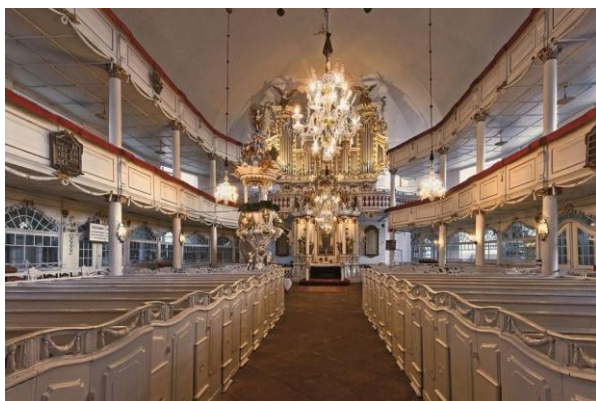
Ewangelicki kościół Zbawiciela

Barokowy kościół p.w. Św. Jana Chrzciciela wybudowany na początku XVIII stulecia - w ołtarzu zobaczymy obraz "śląskiego Rafaela" - Michała Willmanna.