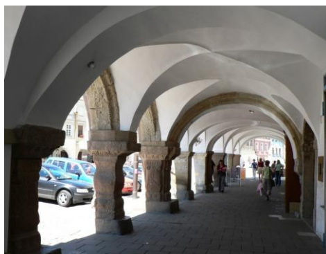
Podcienia w rynku

CENA : 120 zł/os. (w tym przejazd autokarem, opłaty drogowe, obsługa przewodnika, parkingi, ubezpieczenie, podatek VAT). Cena nie obejmuje wstępów.