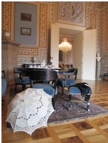
Jedna z sal