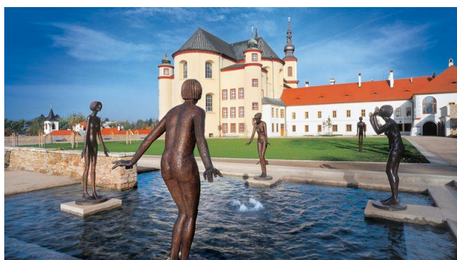
Klasztor pijarów i dawne ogrody klasztorne