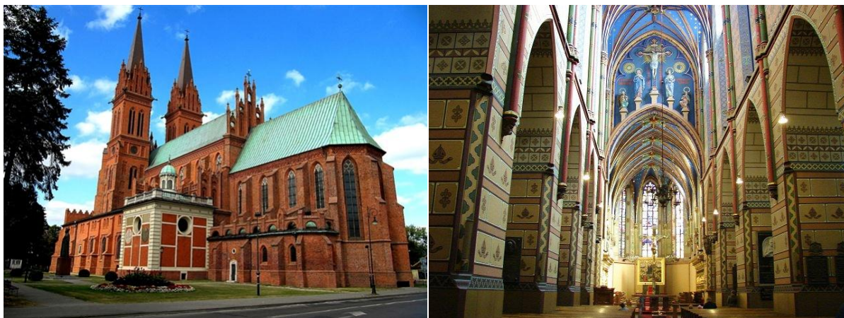
Katedra włocławska i jej wnętrze

Należy do najcenniejszych polskich kościołów. Wzniesiona w XIV wieku, rozbudowana w XV, ostateczny kształt uzyskała w końcu XIX wieku. Wnętrze zawiera wiele bezcennych elementów wyposażenia : tryptyki, witraże, barokowe stalle, obrazy, piękne nagrobki ( niektóre autorstwa Wita Stwosza).