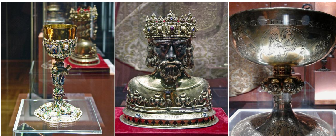
Największe skarby Skarbcza Płockiego

Jest jednym z pięciu najbogatszych skarbców muzealnych w Polsce. Prezentowane są najcenniejsze dzieła złotnicze diecezji płockiej. Kielich i patena Konrada Mazowieckiego z ok. 1240r. oraz czasza puszeki czerwińskiej z ok. 1180 r. Najsłynniejszym dziełem jest relikwiarz hermowy św. Zygmunta fundacji króla Kazimierza Wielkiego z 1370 r. Herma posiada bogato zdobiony piastowski diadem, który prawdopodobnie jest najstarszą koroną w Polsce. Ponadto w skarbcu znajduje się rzadko spotykany emaliowany złoty kielich z fundacji Wazów oraz związany także z tą rodziną – ołtarzyk polowy Konstancji Austriaczki, żony Zygmunta III Wazy. Zobaczmy również bezcenną XII-wieczną Biblię Płocka.