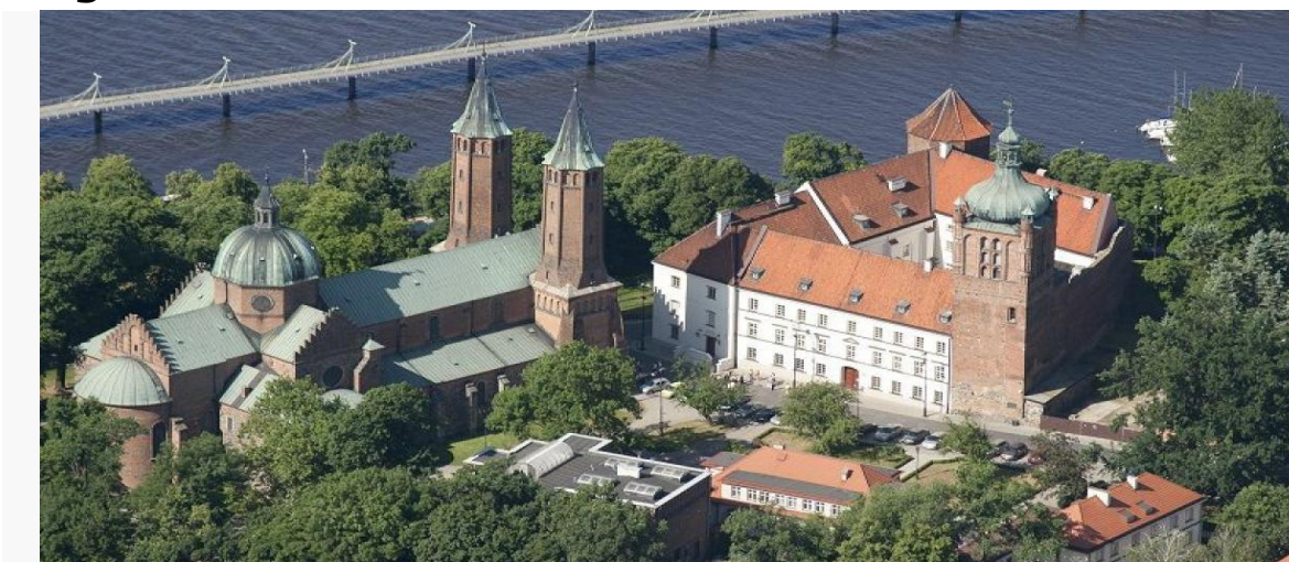
Wzgórze Tumskie – widoczna Katedra Płocka i pozostałości zamku z Muzeum Diecezjalnym

Wzgórze Tumskie to 50-metrowej wysokości nadwiślańska skarpa, jeden z najlepszych punktów widokowych na okolicę. We wczesnym średniowieczu na wzgórzu istniał gród a na przełomie XI/XII wieku mieściła się tu jedna z głównych siedzib władców polskich. Za czasów Kazimierza Wielkiego wybudowano w tym miejscu murowany zamek który był siedzibą książąt mazowieckich do końca XV