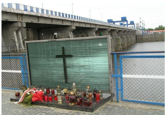
Miejsce stracenia ks. Popiełuszki

pamiętkowy głaz. Pomnik upamiętniający śmierć ks. Jerzego Popiełuszki stanął tu w 1991 roku, po zakończeniu wizyty Jana Pawła II w Polsce. Metalowo-szklaną konstrukcję krzyża widać z daleka, nocą jest podświetlona.