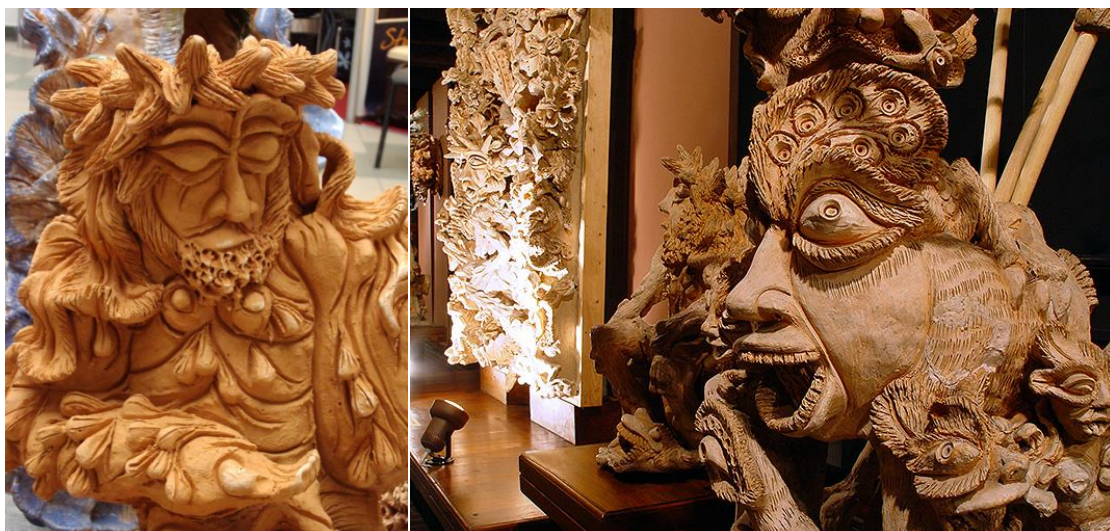
Dzieła Stanisława Zagajewskiego