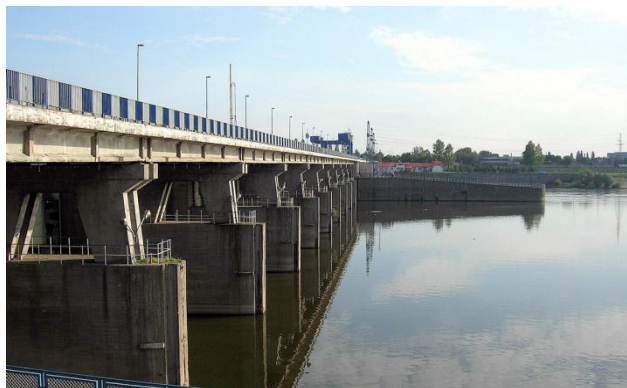
Tama na Wiśle