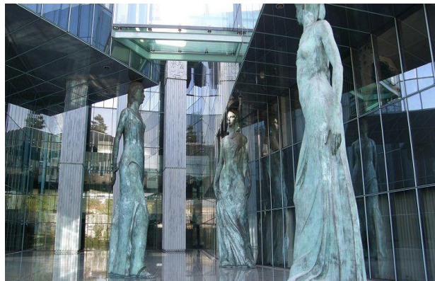
Gmach Sądu Najwyższego