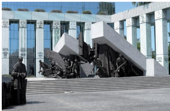
Pomnik Powstańców Warszawskich