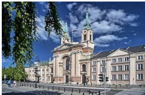
Katedra Polowa Wojska Polskiego