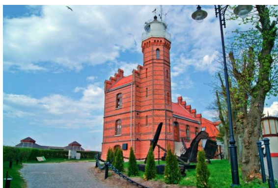
Latarnia morska w Ustce