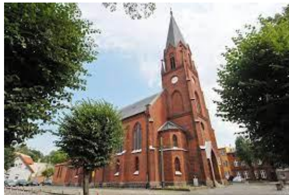
Kościół pw. Najświętszego Zbawiciela