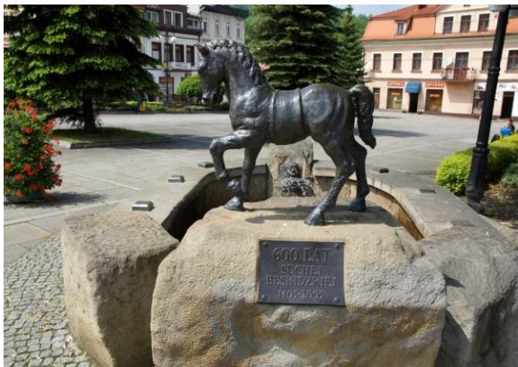
Suski konik na fontannie w rynku

jest blokiem z piaskowca, na którym umieszczony jest konik suski . Natomiast wewnątrz fontanny zostały umieszczone głowy Twardowskiego i diabła Mefistofelesa , z których wypływa woda. Głowy szlachcica Twardowskiego i diabła nieprzypadkowo umieszczono w fontannie, wszak została ona usytuowana przy karczmie „Rzym”, gdzie rozgrywa się akcja ballady Adama Mickiewicza "Pani Twardowska".