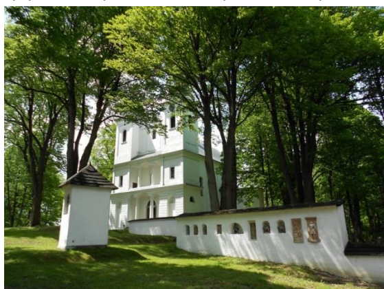
Kościół na wyspie – Galeria Sztuki