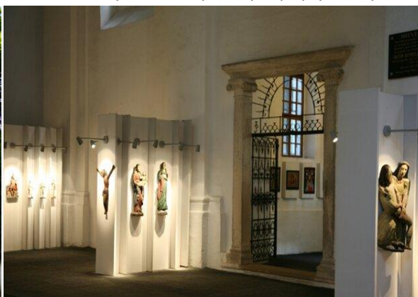
Wnętrze zaadaptowane na muzeum sztuki