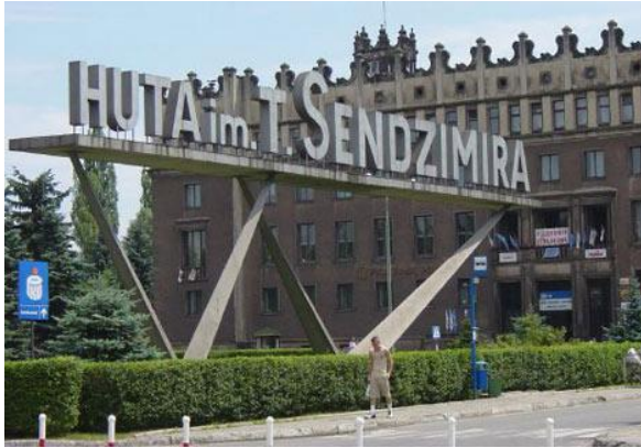
Huta im. T. Sendzimira

Instytucja powstała już w pierwszych latach funkcjonowania Nowej Huty (1955). Wśród ówczesnych mieszkańców Huty nie było łatwo o publiczność teatralną. Mimo trudności, zespół Teatru Ludowego stworzył jedną z najbardziej awangardowych scen w ówczesnej Polsce. Dziś Ludowy również cieszy się znakomitą renomą a jego budynek jest kolejnym fantastycznym przykładem nowohuckiej architektury.