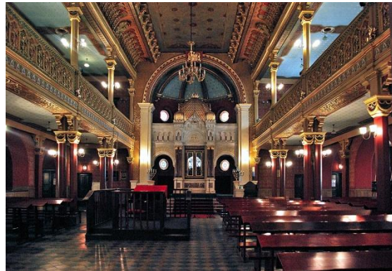
Wnętrze synagogi Tempel