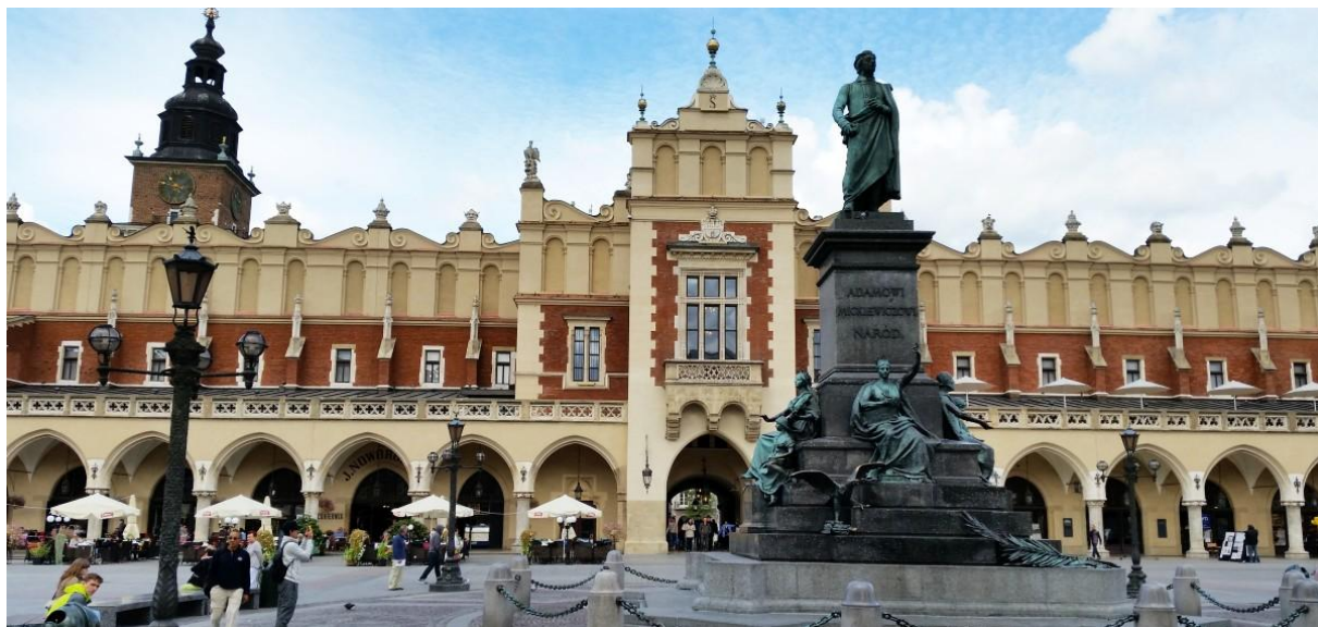
Sukiennice, pomnik Adama Mickiewicza w Rynku

Przerwa kawowa w Rynku, przejście Plantami krakowskimi w kierunku Dzielnicy Uniwersyteckiej