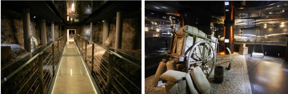
Przejazd do hotelu na obiadokolację.

związane z mieszczaństwem i kupiectwem a także ukazują fundamenty ówczesnych budowli. Muzeum mimo, że dotyczy zamierzchłych czasów, korzysta z współczesnej, zaawansowanej techniki co sprawia, że staje się jeszcze bardziej fascynujące. Podziemna trasa turystyczna ukazuje efekty pięcioletnich badań archeologicznych na tym terenie.