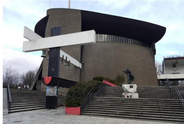
Kościół Arka Pana