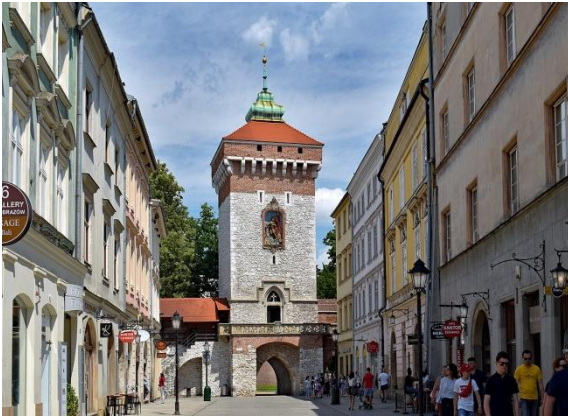
Ulica i Brama Floriańska