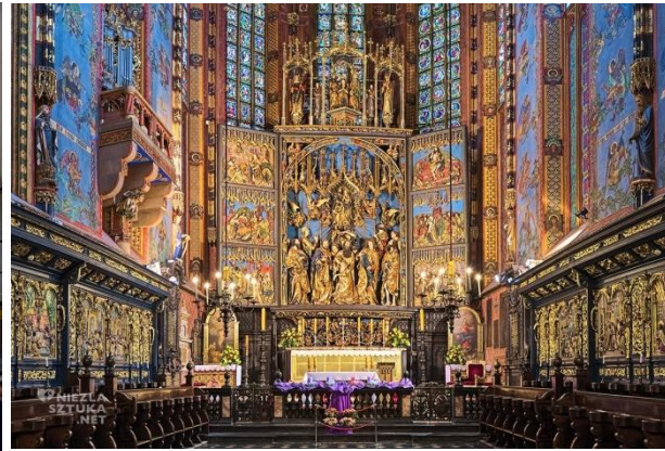
Ołtarz Wita Stwosza w Kościele Mariackim