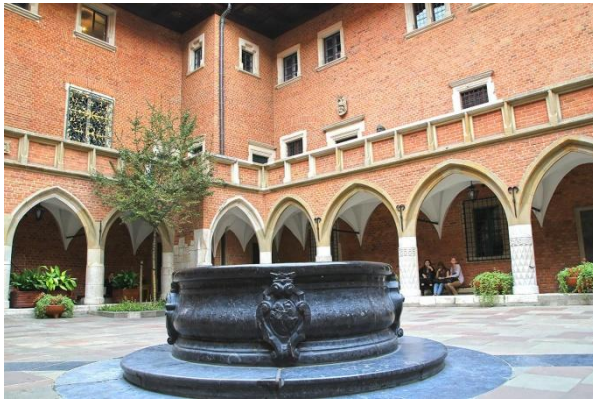
Dziedziniec Collegium Maius

Najstarszy budynek uniwersytecki, piękny przykład architektury gotyckiej. Pośrodku arkadowego dziedzińca znajduje się studnia. Wejdziemy na dziedziniec